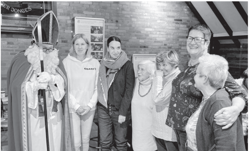
Der Nikolaus bedankte sich bei den Jongesfrauen, die etwa beim Mühlentag und beim Familienfest tatkräftig angepackt haben.

Und alle bekamen Geschenke. Jeder Anwesende bekam einen leckeren Weck-