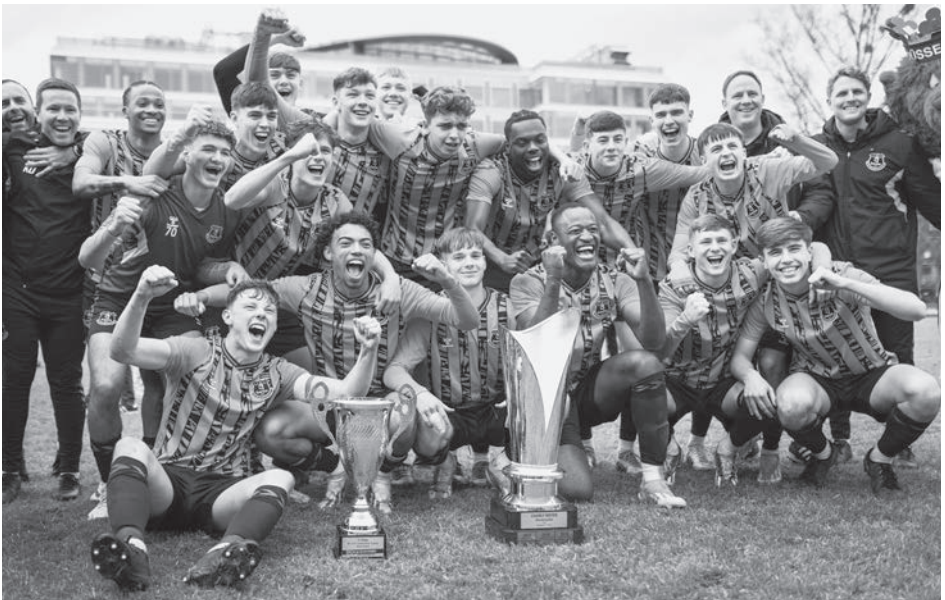
Der FC Everton hat das 60. BV 04 Osterturnier um die U19 Champions Trophy gewonnen. Die Engländer setzten sich im Endspiel gegen den Sydney FC durch.

Vier Tage lang hat es auf der Anlage des BV 04 U19-Fußball der Spitzenklasse gegeben. Vor allem die Australier haben viele neue Fans gewonnen. Im Halbfinale etwa haben sie das Spiel gegen Borussia Mönchengladbach nach 0:2-Rückstand noch mit 3:2 gewonnen. Vor allem der